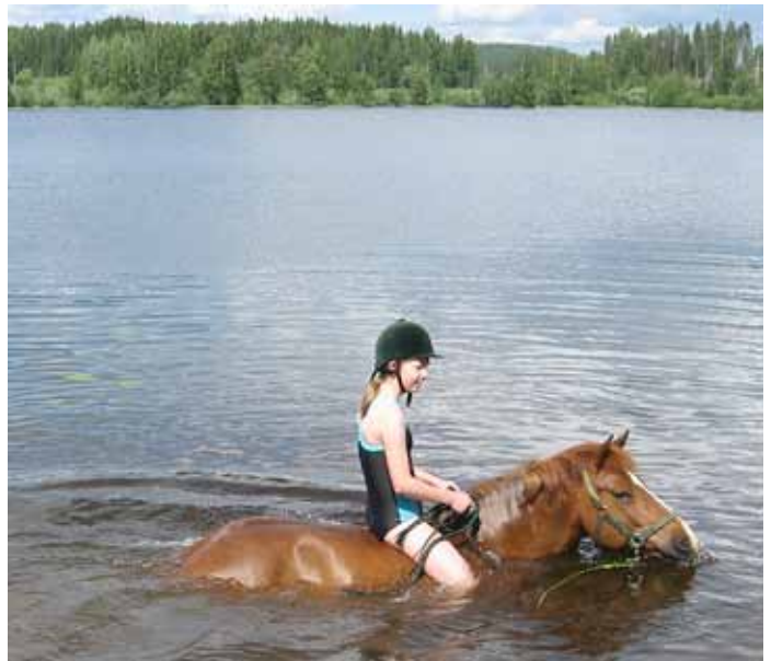
Mäkipään tila tarjoaa maastoratsastusta ja retkiä suomenhevosilla sekä suomenpienhevosilla.