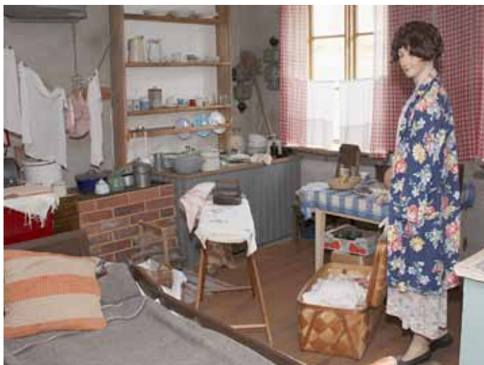
Sota-aikana oli keittiökin asuinkäytössä ja Koskenjalkaan museoidussa työläiskodissa kerrotaan tämän ajan asumisesta.

voi ostaa kädentaitajien tuotteita itselle tai tuliaiseksi. Lylyn SA-myymäälä on keräilijän unelma, mutta sieltä löytyy myös paljon siviilikäyttöönkin sopivia työkaluja, laitteita ja tarvikkeita. Myllymuksujen tehtaanmyymälä Kopsamolla tarjoaa edullisia luomutuotteita bambusta, froteesta ja merinovillasta. Näistä on valmistettu Muksut ja Maijat asuja hauskoissa väreissä ja kivoissa kuoseissa. Muksupuodista voi hankkia myös kankaita ja lisäksi kaikkea muuta ompeluun liittyvää.