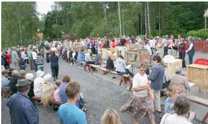
Lylyn kesälauantaita vietetään nyt 30-vuotismärkeissä ja asema-aukiolla päivää juhliitaan perinteiden mukaan, mutta yllätysohjelmaakin on luvassa