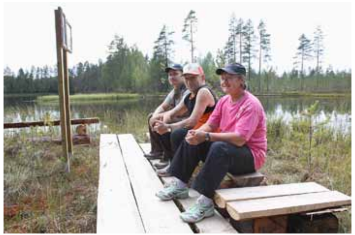
Kaaponharjun luontopolku Lylyssä sopii patikoitavaksi perheen pienempienkin kanssa ja eväitä voi nauttia puolivälin taukopaikalla Pajulammen rannalla.

Aivan Korkeakosken keskustassa on jääkauden myötä syntynyt luonnontähtävyys, Juupajoen raviinerotko, joka on ainutlaatui-