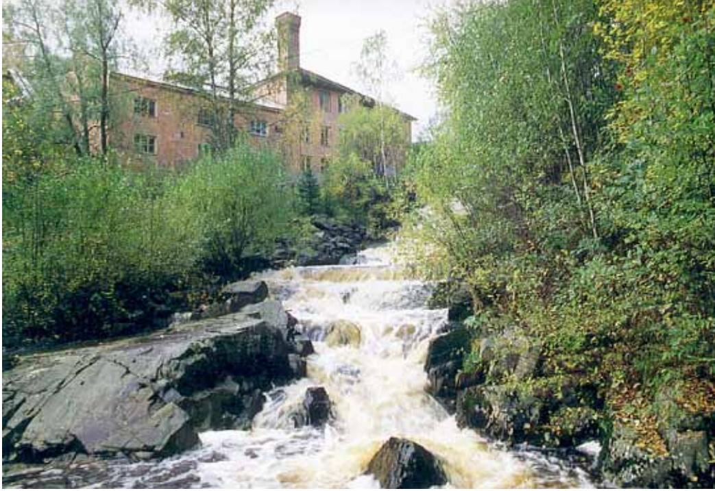
Korkeakoski on tuottanut sähköä jo vuodesta 1895. Entisessä nahkatehtaassa olevan Koskenjalan museon ikkunoista on näkymät koskeen ja siitä alkavaan Juupajoen rotkoon.

Kesäisiin monipuolisiin matkailukohteisiin Kallenautioon ja Koskenjalkaan on Juupajoella helppo poiketa, sillä 66- ja 58-tiet kulkevat kunnan kautta. Tampereelta Juupajoelle pääsee autolla alle tunnissa samoin myös taajamajunalla, joka pysähtyy Korkeakosken keskustassa. Tänäkin vuonna Juupajoen kesä tarjoaa myös monia mukavia tapahtumia sekä tasokkaita taidenäyttelyitä ja mielenkiintoisia museokierroksia, edullisia ostospaikkoja sekä ainutlaatuisia luontoelämyksiä ja erilaisia harrastusmahdollisuuksia.