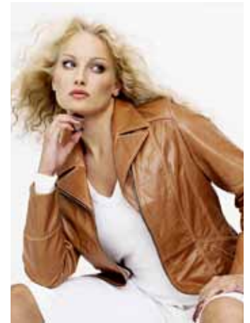
Big-L myymälän laadukkaat nahka-asut ovat hyvin edullisia Koskenjalassa.

Kulttuurin ohessa myös edulliset ostokset onnistuvat. Koskenjalassa olevasta Big-L myymälästä voi hankkia muodikkaat nahka-asut puoleen hintaan ja Juupajoki-myyntinäyttelyssä on paikkakunnan laadukkaita käsityötuotteita. Myös Kallenaution Hollituvan myymälästä