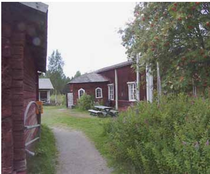
Kallenaution avoin portti kutsuu tänäkin kesänä matkailijoita levähtämään aidossa kievarimiljöössä.

nen lehtomaisen kasvillisuutensa ja geologiensa vuoksi. Tästä luontoelämyksestä voi nauttia rotkon kunnostettuja polkuja ja siltoja kulkien. Pysäköintipaikalta johtavat rappuset alas ja sieltä voi kiertää vanhan, vielä toimivan voimalaitoksen ohitse Koskenjalan museolle. Keskustan ja koulukeskuksen yhdistävä kävelytie seurailee myös osittain jokea sekä horhaa ja alakosken partaalla on levähdyspaikka pöytineen.